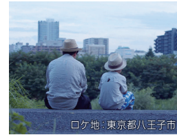
ロケ地：東京都八王子市

最後の生活 22分 監督：渡邊高章 ヒューマンドラマ 父を亡くしてから学校へ行けなくなった小学生の春陽の元に、母の兄である小説家の「おじさん」がやってきた。春陽とおじさんの心の交流を描いたある夏の物語。