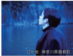
ロケ地：神奈川県箱根町

湖の底から見る風景 14分 監督：森実知子 サスペンス ミステリー・ホラー 湖の側の別荘で繰り広げられるサイコサスペンス。スランプに陥る推理作家の前に現れた正体不明の青年を表向きはアシスタント、実際はゴーストライターとして雇う。完璧なトリックで攻める作家と鮮やかなストーリーを紡ぎだす青年の結末は…。