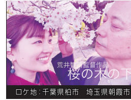
ロケ地：千葉県柏市 埼玉県朝霞市

桜の木の下 18分 監督：荒井智晴 ミステリー・恋愛 ヒューマンドラマ 初老の男性がベンチに行んでいる。その隣には若い女性がひとり寄り添う。彼は彼女に想い出話を聞かせる。